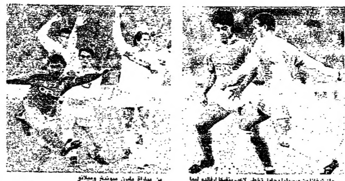
جان نيغمان من مرسلينا يحاول تخفي لاعب بيفيكا ارفانو لينا من مباراة بيلين ميونخ وميلانو